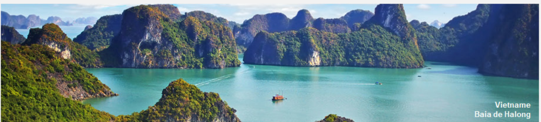
Vietname Baía de Halong