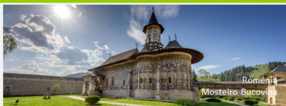
Roménia Mosteiro Bucovina