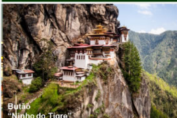
Butão "Ninho do Tigre"