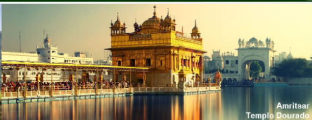
Amritsar Templo Dourado