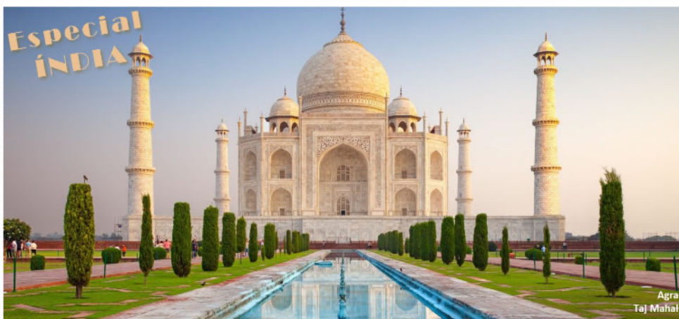
Agra Taj Mahal