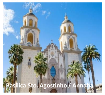
Basílica Sto. Agostinho / Annaba

Continuação da viagem para Constantine . À chegada, breve panorâmica pela Cidade das Pontes . Jantar e alojamento no Hotel Marriott Constantine 5* .