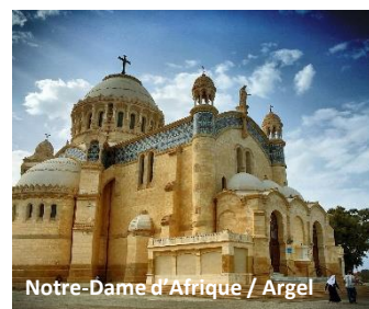
Notre-Dame d'Afrique / Argel