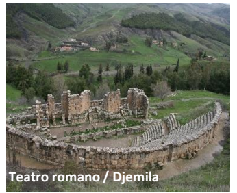
Teatro romano / Djemila

Jantar e alojamento no Hotel Park Mall Setif 4* .