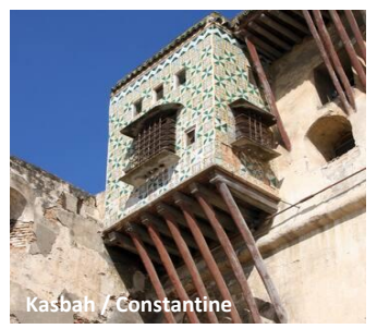
Kasbah / Constantine

Após o almoço, mergulhamos na atmosfera animada da Medina (Kasbah) , com as suas ruas estreitas e as suas lojas coloridas. Passeamos pelo antigo souk , onde os aromas envolventes das especiarias e dos produtos locais nos encantam. Jantar e alojamento no Hotel Marriott Constantine 5* .