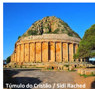
Túmulo do Cristão / Sidi Rached

Chegada a Annaba, cidade rica em história onde Santo Agostinho viveu e faleceu, e transporte para o Hotel Sheraton Annaba 5* . Jantar e alojamento.