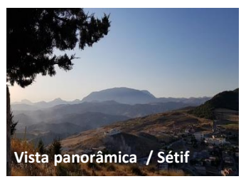
Vista panorâmica / Sétif