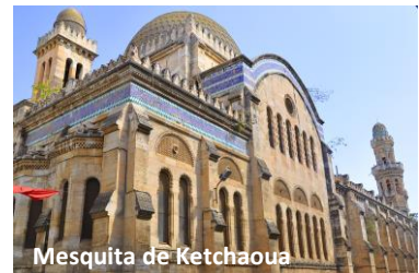
Mesquita de Ketchaoua

No final das visitas, transporte para o aeroporto de Algers. Formalidades de embarque e partida para Lisboa, em voo regular Air Algerie, com partida de Algers às 19h25 . Chegada ao aeroporto de Lisboa pelas 21h30.