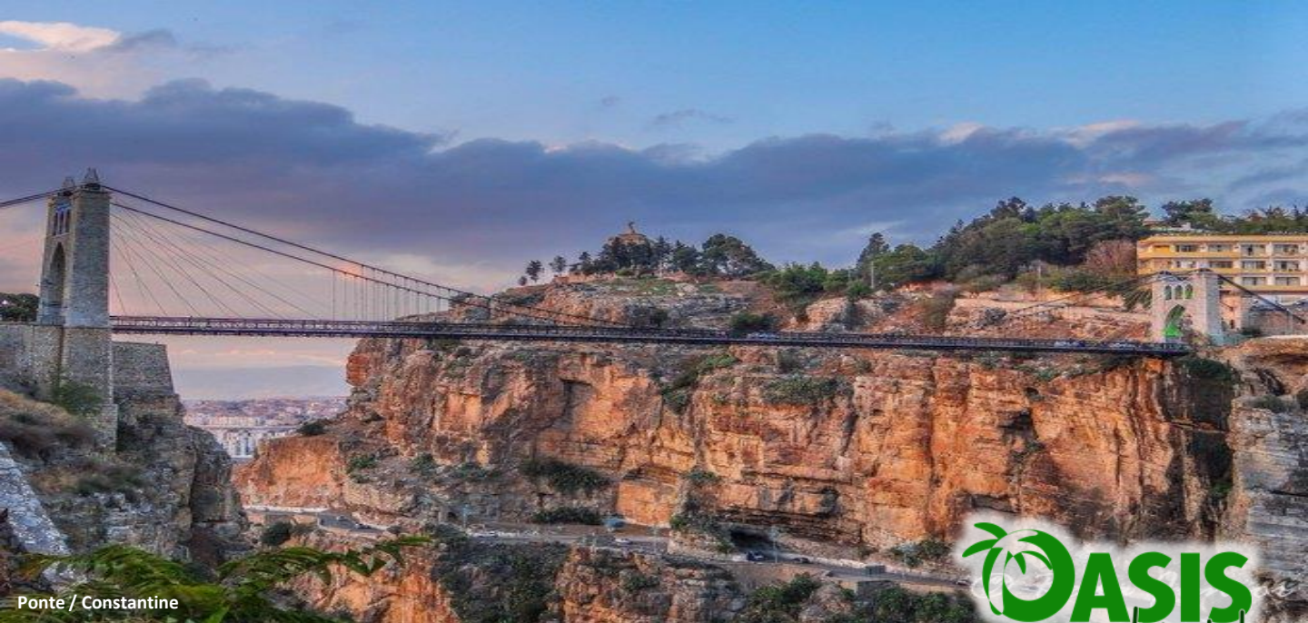
Ponte / Constantine