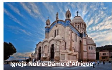
Igreja Notre-Dame d'Áfrique

Após o pequeno-almoço, partida de Setif por auto-estrada em direcção a Argel, a vibrante capital da Argélia. Chegada a Alger e almoço em restaurante local. Após o almoço, iremos explorar a capital argelina, começando com a Igreja de Notre-Dame d'Áfrique , cuja construção demorou cerca de 14 anos e resultou da persistência de duas jovens católicas de Lyon que cuidavam da manutenção do seminário de Argel. Este magnífico edifício religioso está localizado no topo de uma colina, oferecendo uma vista abrangente da cidade e do mar Mediterrâneo. O seu interior ricamente decorado, impregnado de história e espiritualidade, permite-nos entender melhor a importância desta igreja no cenário cultural e religioso de Argel, bem como o seu papel como símbolo de tolerância e coexistência Inter-religiosa na região. Jantar e alojamento no Hotel Sofitel Algiers Hamma Garden 5* ou Legacy Luxury Hotel Algiers 4* .