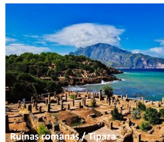
Ruínas romanas / Tipaza