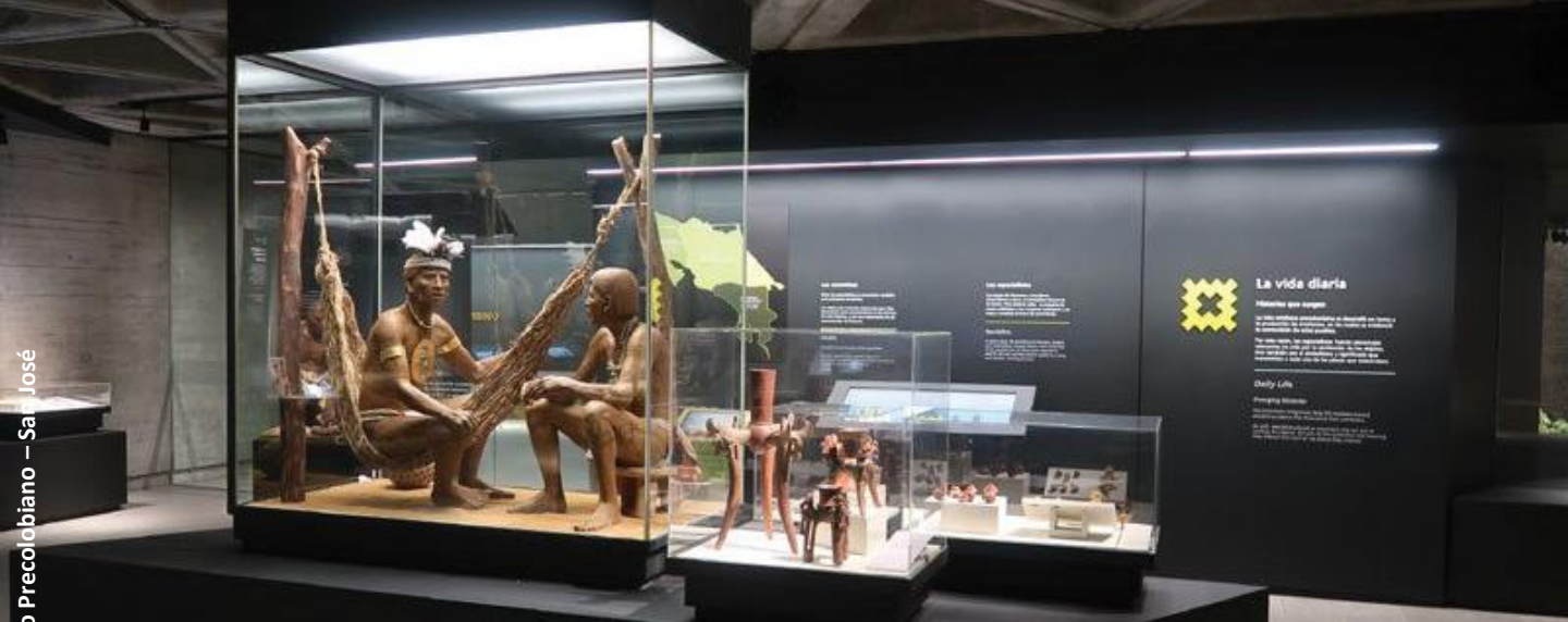
Museu de Ouro Precolombiano – San José