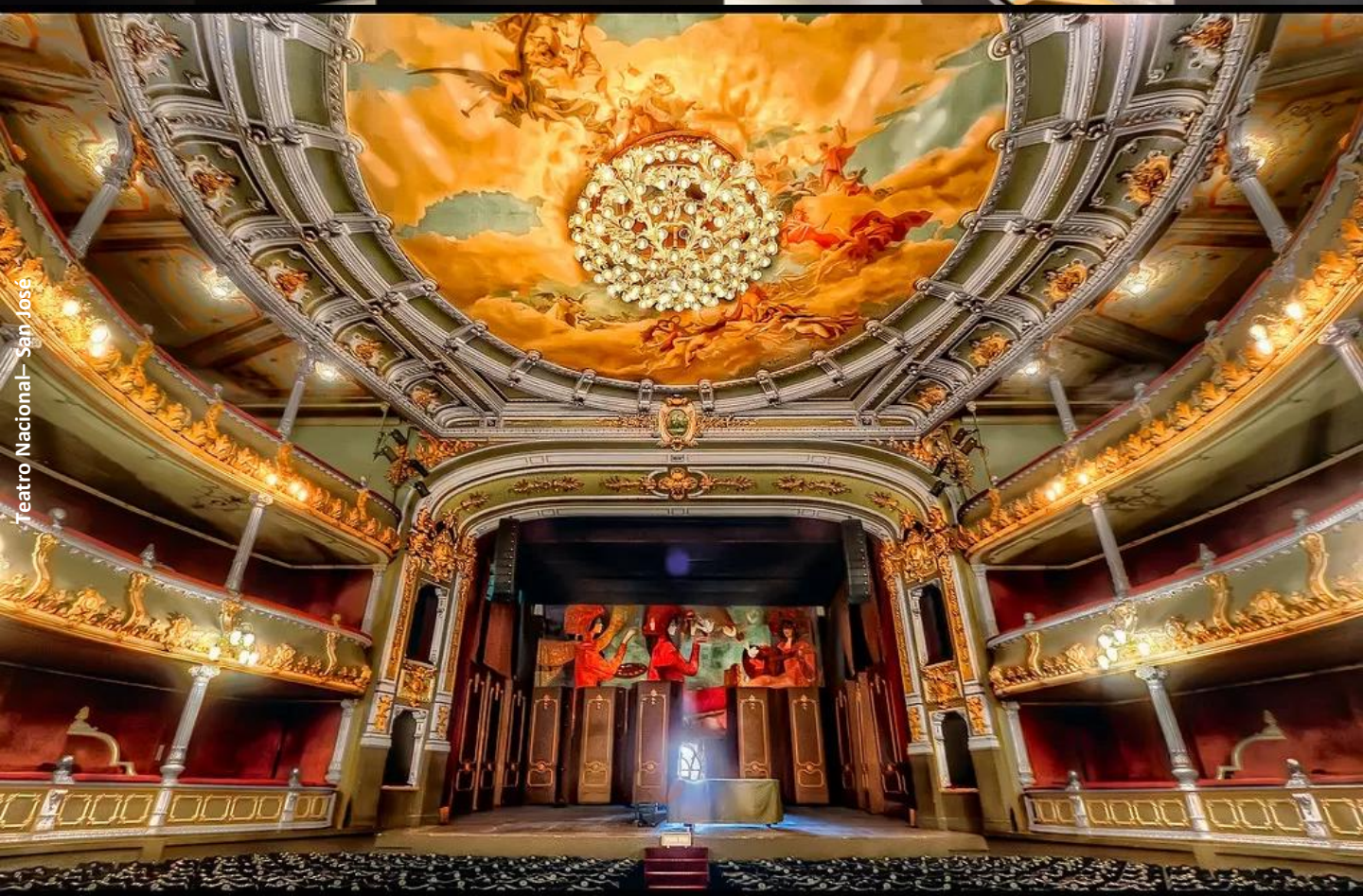
Teatro Nacional – San José