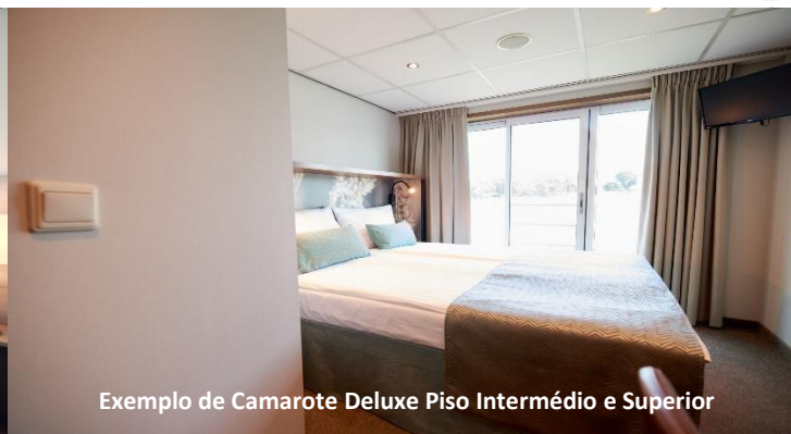
Exemplo de Camarote Deluxe Piso Intermédio e Superior

RNAVIT 8323 – Cap.Social 50.000€ – NIPC: 515239550