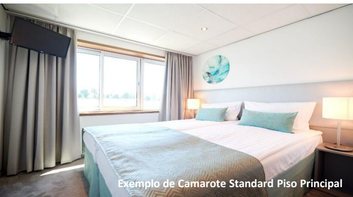
Exemplo de Camarote Standard Piso Principal