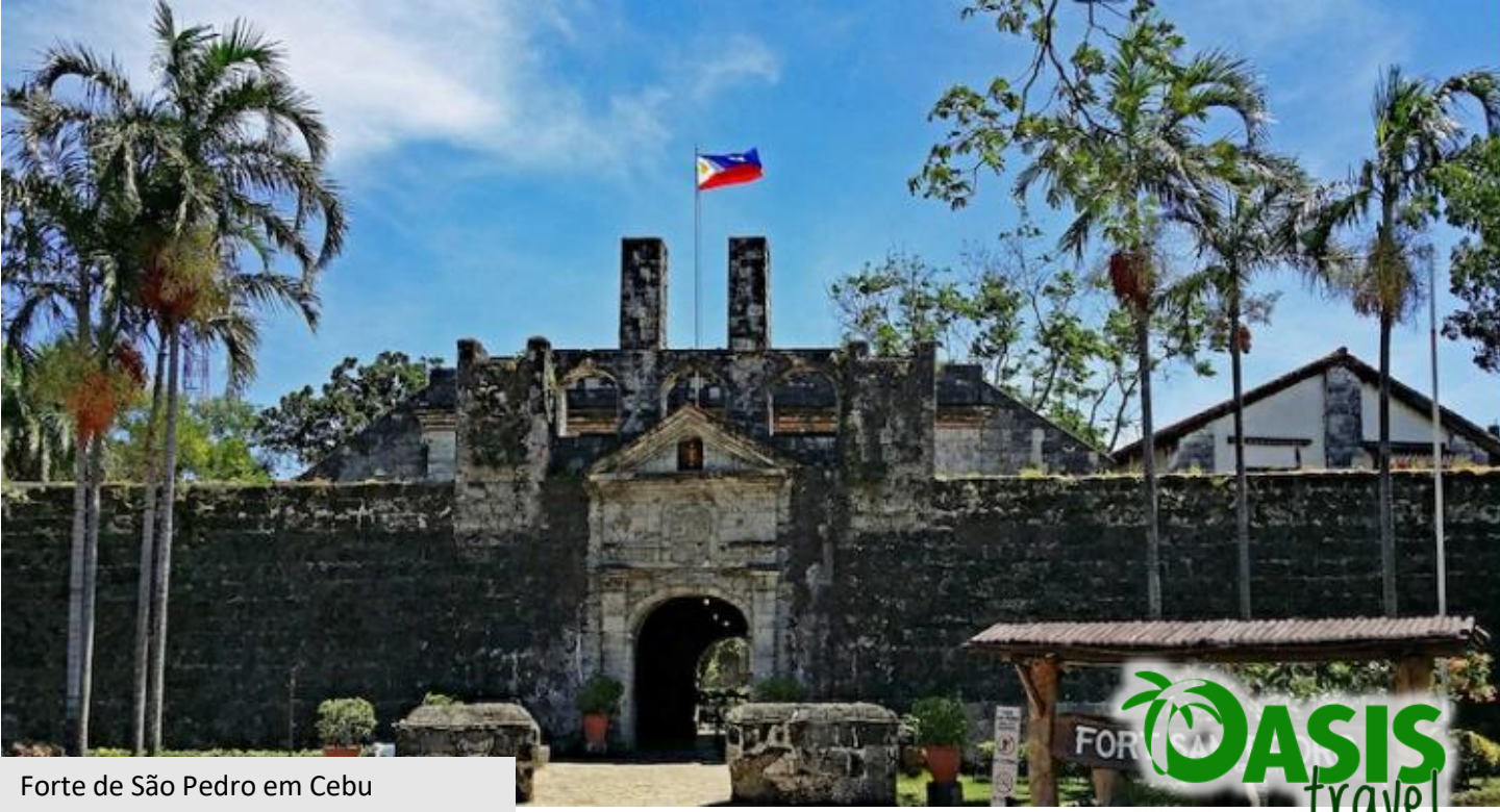
Forte de São Pedro em Cebu