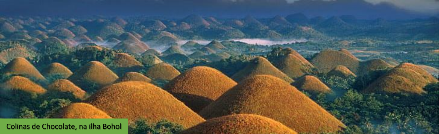
Colinas de Chocolate, na ilha Bohol