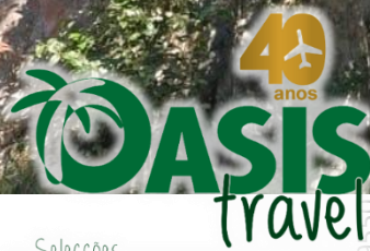
Caixões suspensos de Sagada