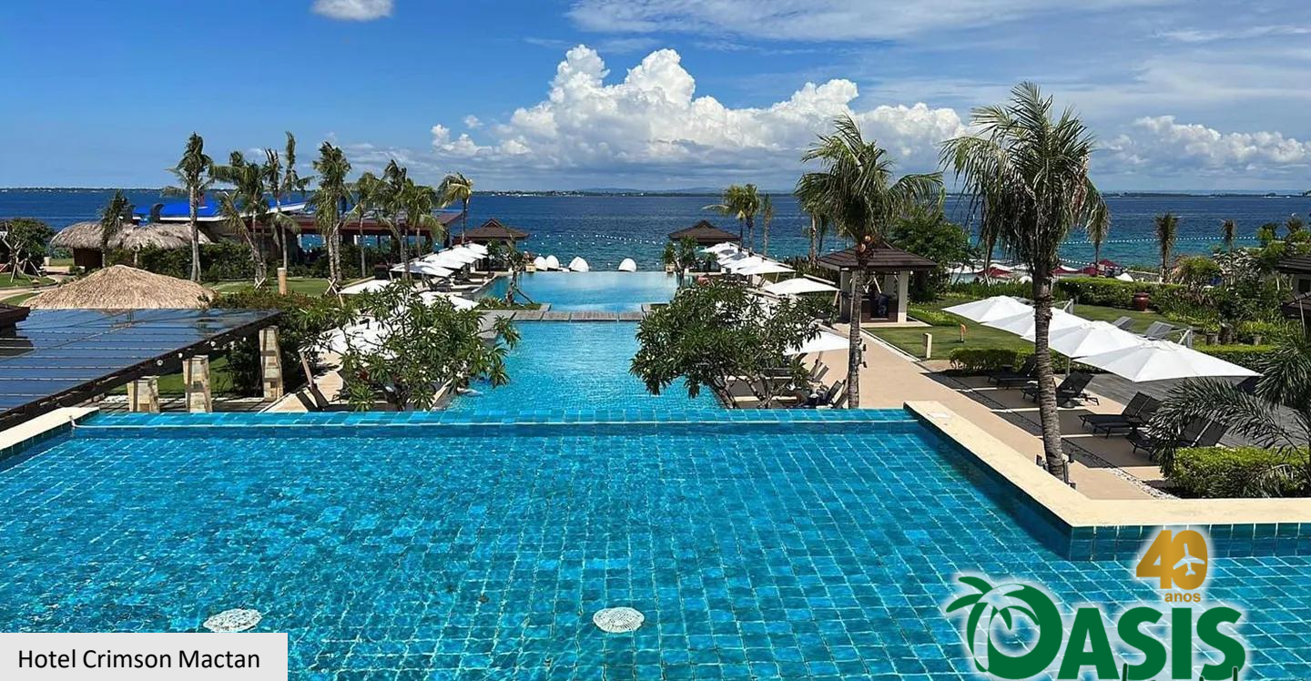
Hotel Crimson Mactan