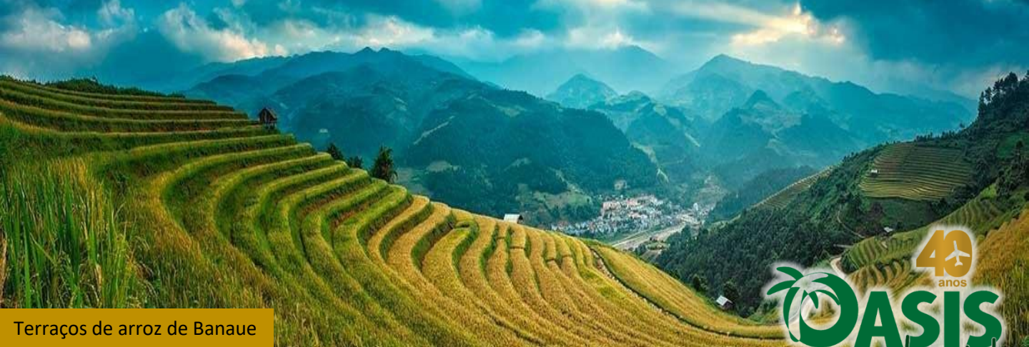
Terraços de arroz de Banaue