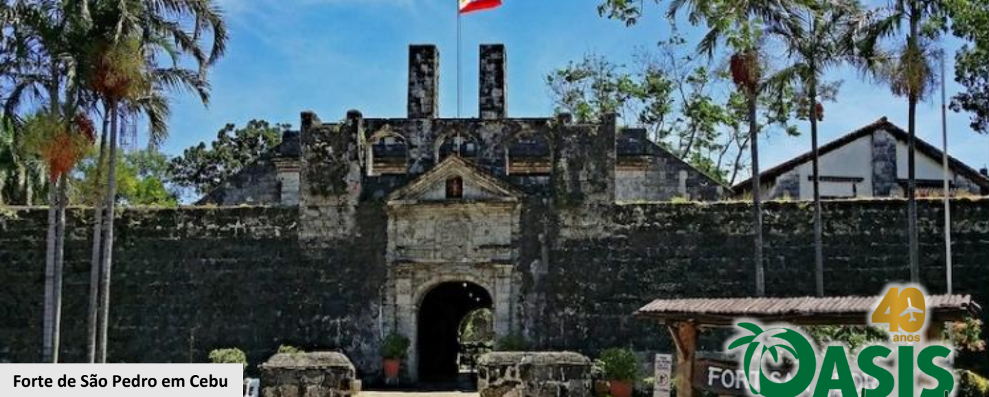
Forte de São Pedro em Cebu