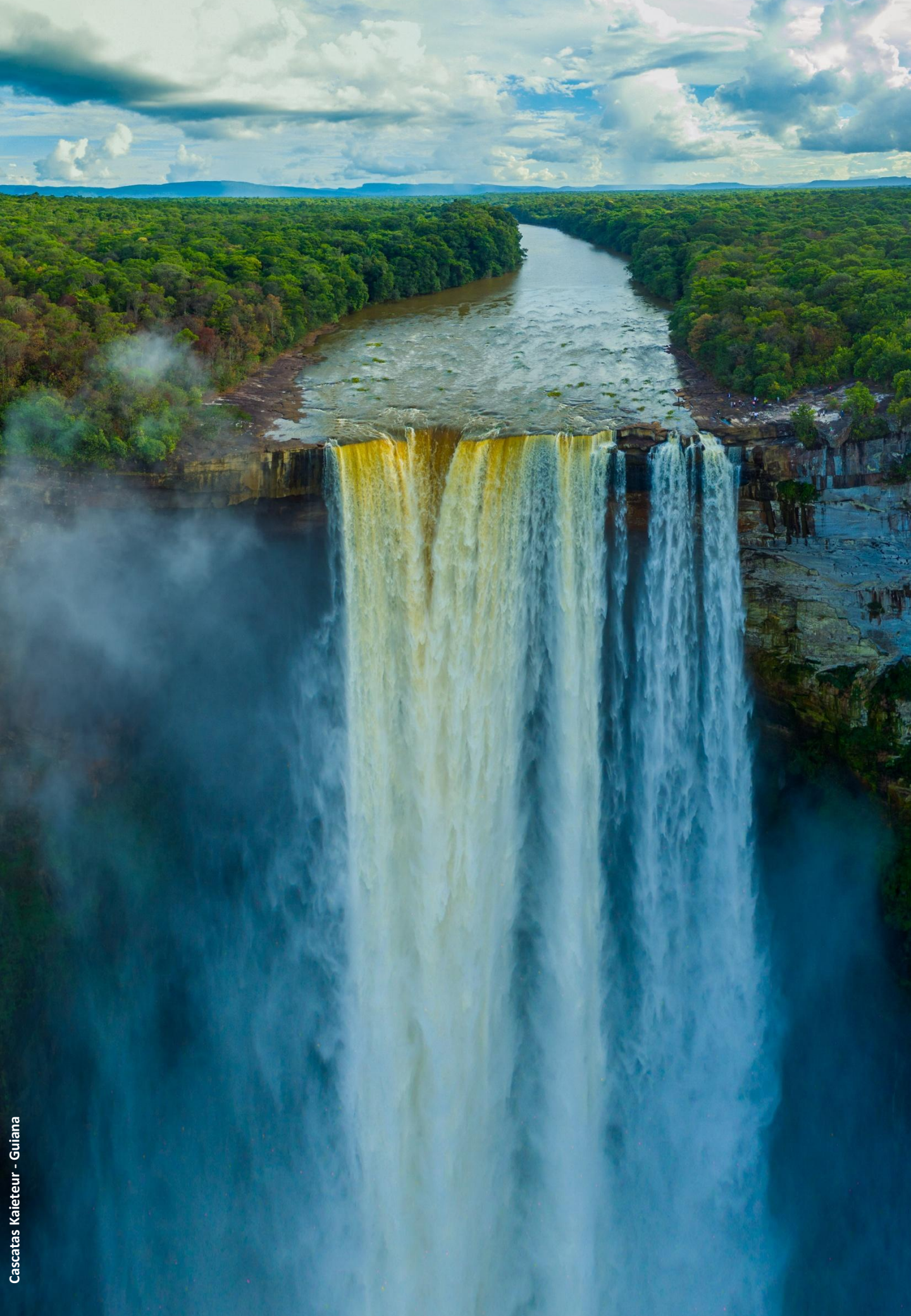
Cascatas Kajeteur - Guiana