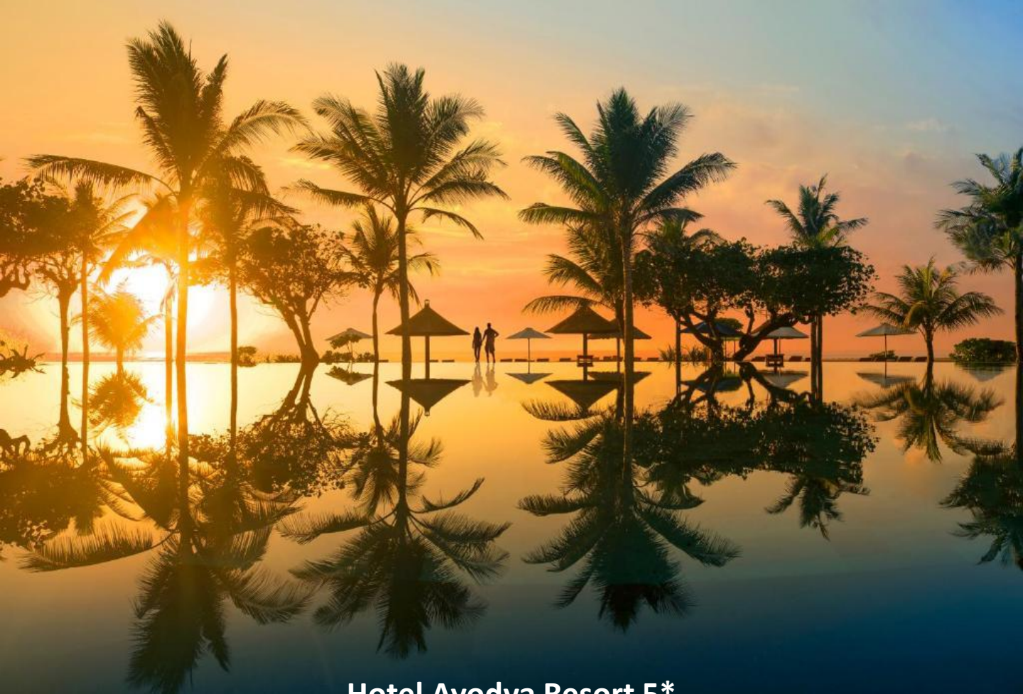
Hotel Ayodya Resort 5*